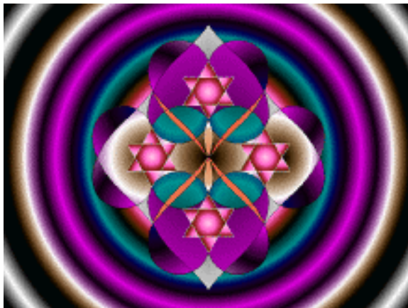
Figura 2. Corazón Sagrado

Esta primera colección utilizó el enfoque de la metodología cuantitativa. Se realizaron encuestas a hombres jóvenes universitarios entre los 18 y 40 años de edad, con preguntas de selección múltiple para identificar la cantidad de personas que relacionaban una imagen con diversas sensaciones o se sentían atraídas por cada una de las simbologías propuestas y los diferentes tipos de colores.