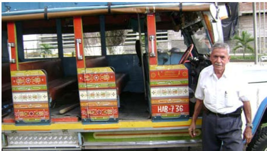
Figura 3. Propietario junto a la chiva.

las respuestas, extrayendo elementos comunes que fueron plasmados en el proyecto, con el fin de retroalimentar el conocimiento de quien efectúa la investigación, ayudándole a interpretar y aclarar los diferentes símbolos, colores y gráficos que la chiva tiene.