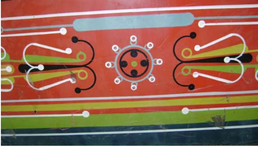
Figura 2. Diseño popular.