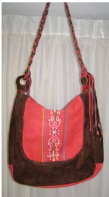
Figura 4. Bolso de la colección “Nativo”.

Es una colección moderna de accesorios (bolsos), con detalles artesanales típicos, para mujeres jóvenes e innovadoras.