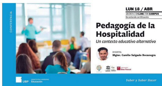
Ilustración 2. Invitación conferencia.

En la Universidad Blas Pascal, se dictó la conferencia: Pedagogía de la Hospitalidad, un contexto educativo alternativo, contando con la participación de estudiantes y profesionales del ámbito educativo, de Argentina y otros países de la región, compartiendo las experiencias de la asignatura homóloga [13].