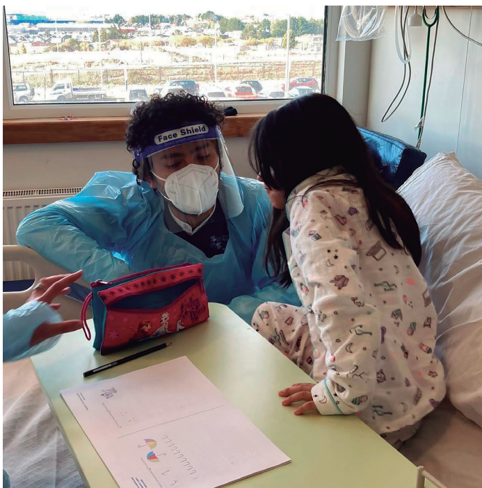
Fotografía 2. Acompañamiento estudiante paciente en sala cama, Hospital Clínico de Magallanes, Punta Arenas, Chile (2022).

El Aula Hospitalaria se ha venido reactivando luego del confinamiento y algunos procesos escolares son mediados por la tecnología, lo cual es una ganancia en términos de cobertura y accesibilidad para la población infantojuvenil, habitantes de la Patagonia Chilena y el estrecho de Magallanes.