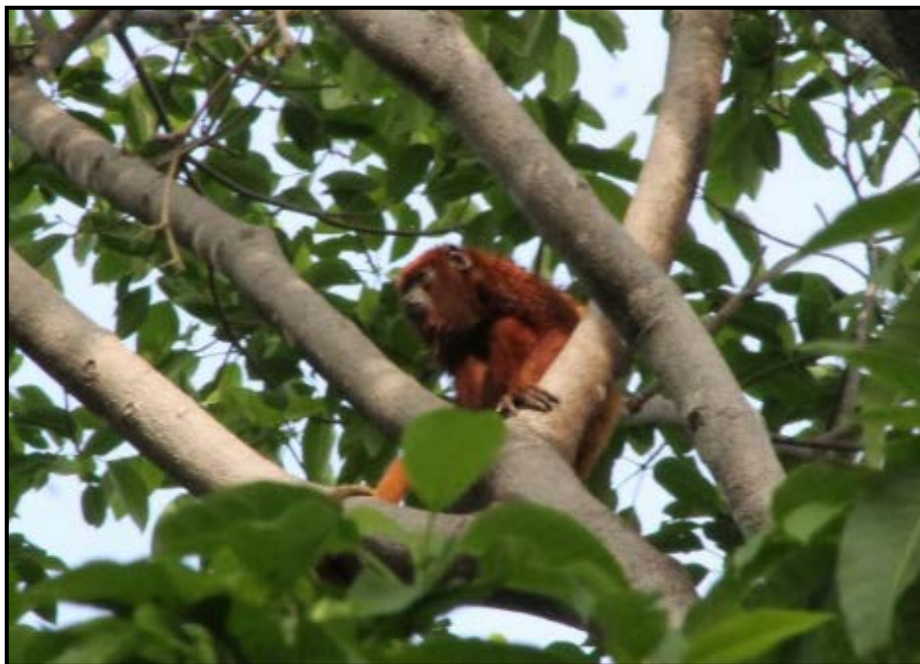
Figura 1. Individuo de Mono Aullador Rojo ( Alouatta seniculus ).