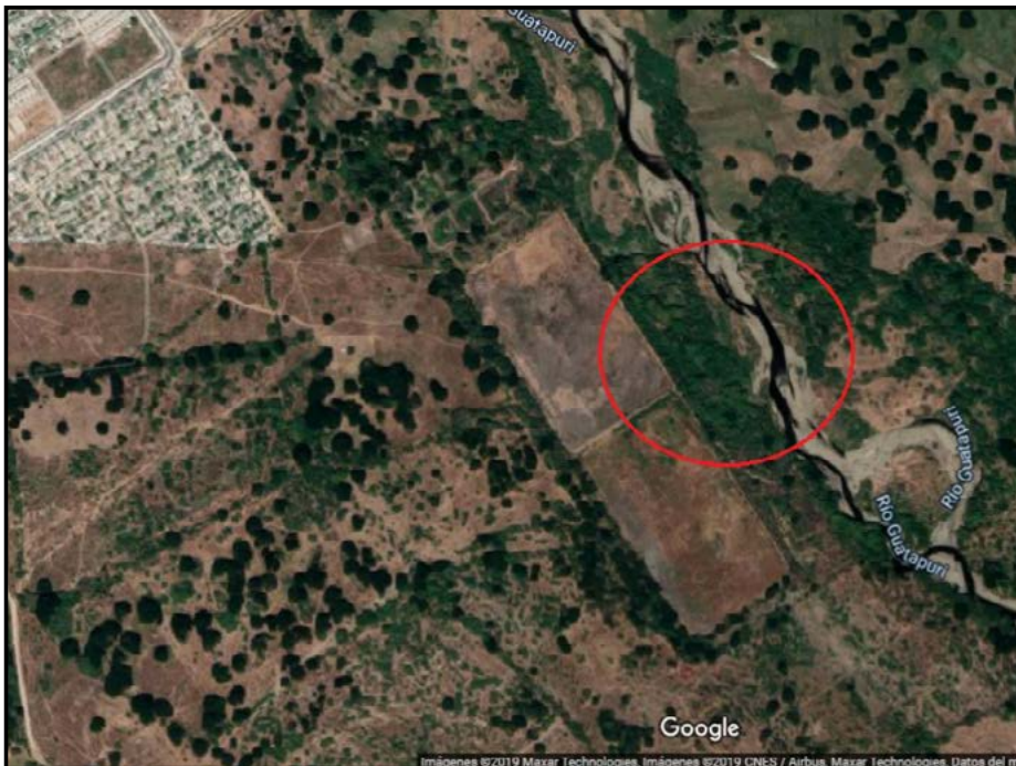
Figura 2. Hábitat de Monos Aulladores en la PTAR El Tarullal.

El área específica de hábitat de las colonias de Mono aullador rojo se ubicó en la parte lateral de las lagunas de maduración de la Planta de tratamiento de aguas residuales El Tarullal, al lado del río Guatapuri (figura 2). Se estimó por conteo directo una densidad ecológica de 7 individuos y 3 grupos/km 2 , la cual es inferior a datos normalmente reportados para la especie en otras zonas de la costa Atlántica, igualmente inferior en fragmentos aislados de bosques de montaña. A pesar de la baja densidad, los grupos presentaron un tamaño y composición similar a los registrados para la especie, con mayor número de individuos inmaduros que de hembras adultas sugiriendo que la población se encuentra en condiciones estables.