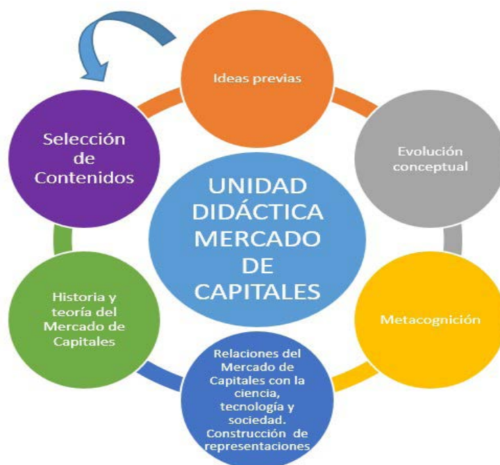
Figura 1. Modelo de Unidad Didáctica.