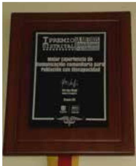
FOTO RECONOCIMIENTO DISTRITAL