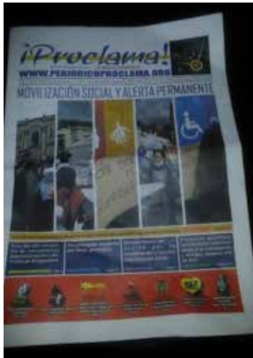
FOTO DE LA PORTADA DEL PERIÓDICO PROCLAMA