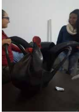
FOTO DE PRODUCTOS ELABORADOS