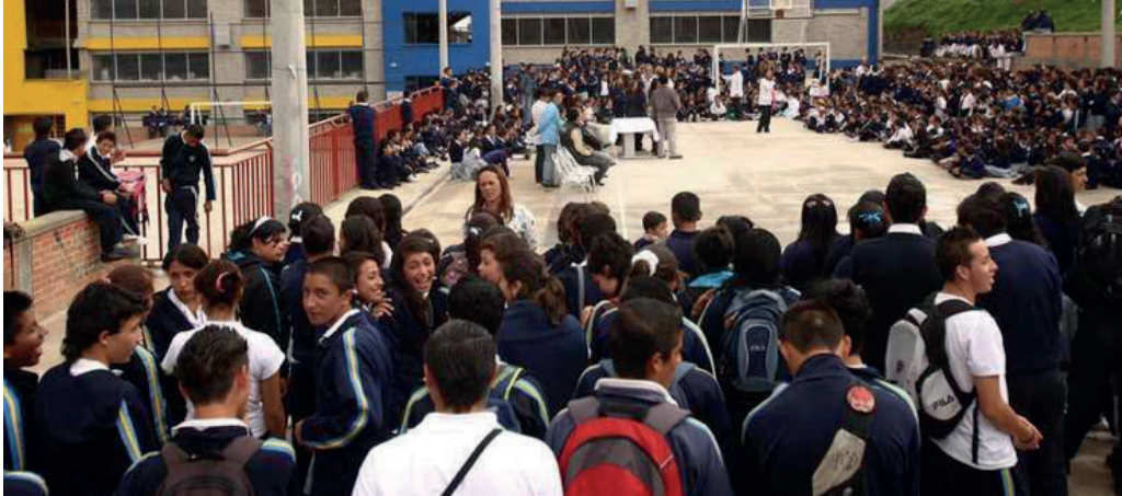
FIGURA 3. PANORAMICAS DE SOACHA