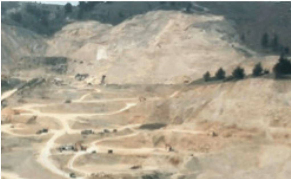
FIGURA 8. SOACHA Y SUS CANTERAS