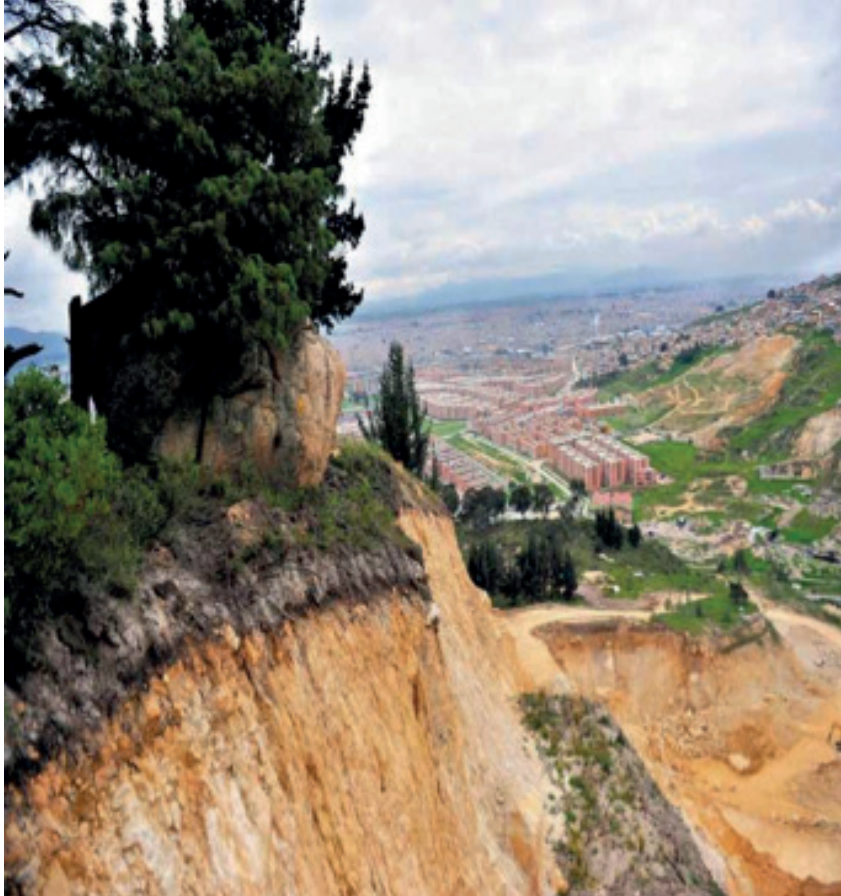
FIGURA 9. CANTERAS DEL MUNICIPIO DE SOACHA