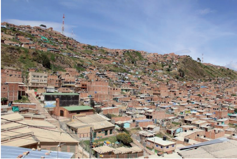
FIGURA 1. SOACHA