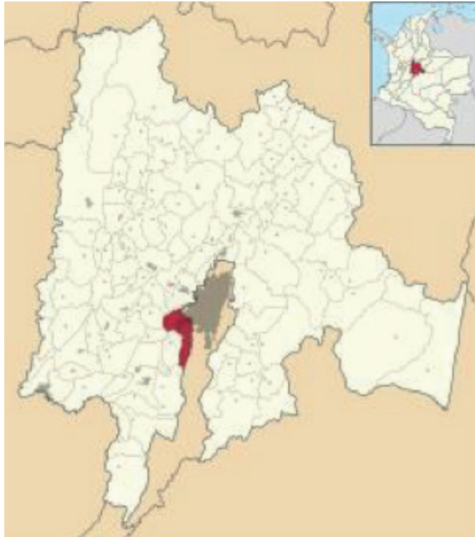
FIGURA 2. LOCALIZACIÓN DE SOACHA EN CUNDINAMARCA