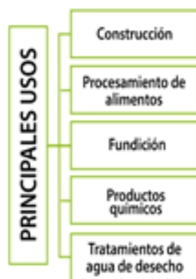
Figura 3. Principales usos de la roca caliza

Es por esto que su proceso de transformación y obtención de productos derivados, ha permitido el desarrollo de diversas regiones, debido a su aplicación como materia prima del cemento, lo que la posiciona como un material clave en el sector de la construcción. (López, 2010)