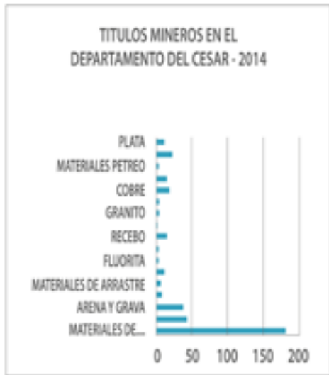
Figura 1. Títulos mineros en el departamento del Cesar 2014

Se pueden inferir de la gráfica 1 aspectos fundamentales como lo son la variedad de áreas de influencias con títulos de concesiones para explotar, de igual forma, la importancia que recae en la utilización de materiales de construcción en el departamento del Cesar, ya que consta de 370 títulos aprobados, distribuidos en materiales de construcción con 182 títulos, la arcilla con siete títulos, la fluorita con dos títulos, asfalto con un título, cobre con 18 títulos, oro con 21 títulos, caliza con 43 títulos, el material de arrastre con seis títulos, balastro con dos títulos, granito con dos