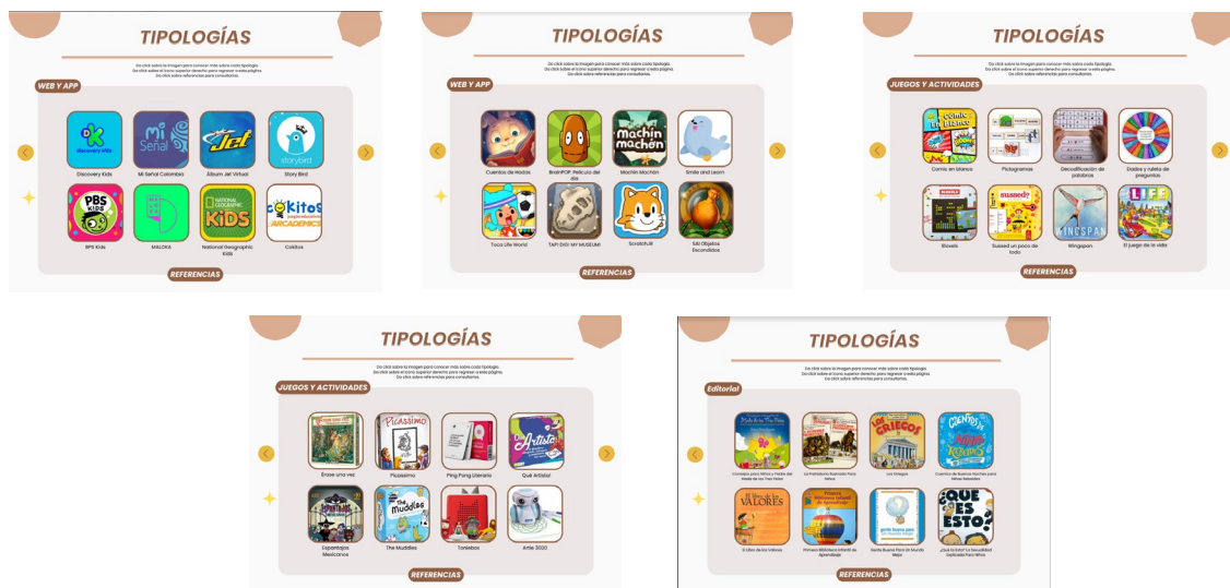
Imagen 1. Tipologías

Marco tipológico sobre juegos de literatura y/o arte. Elaboración propia.