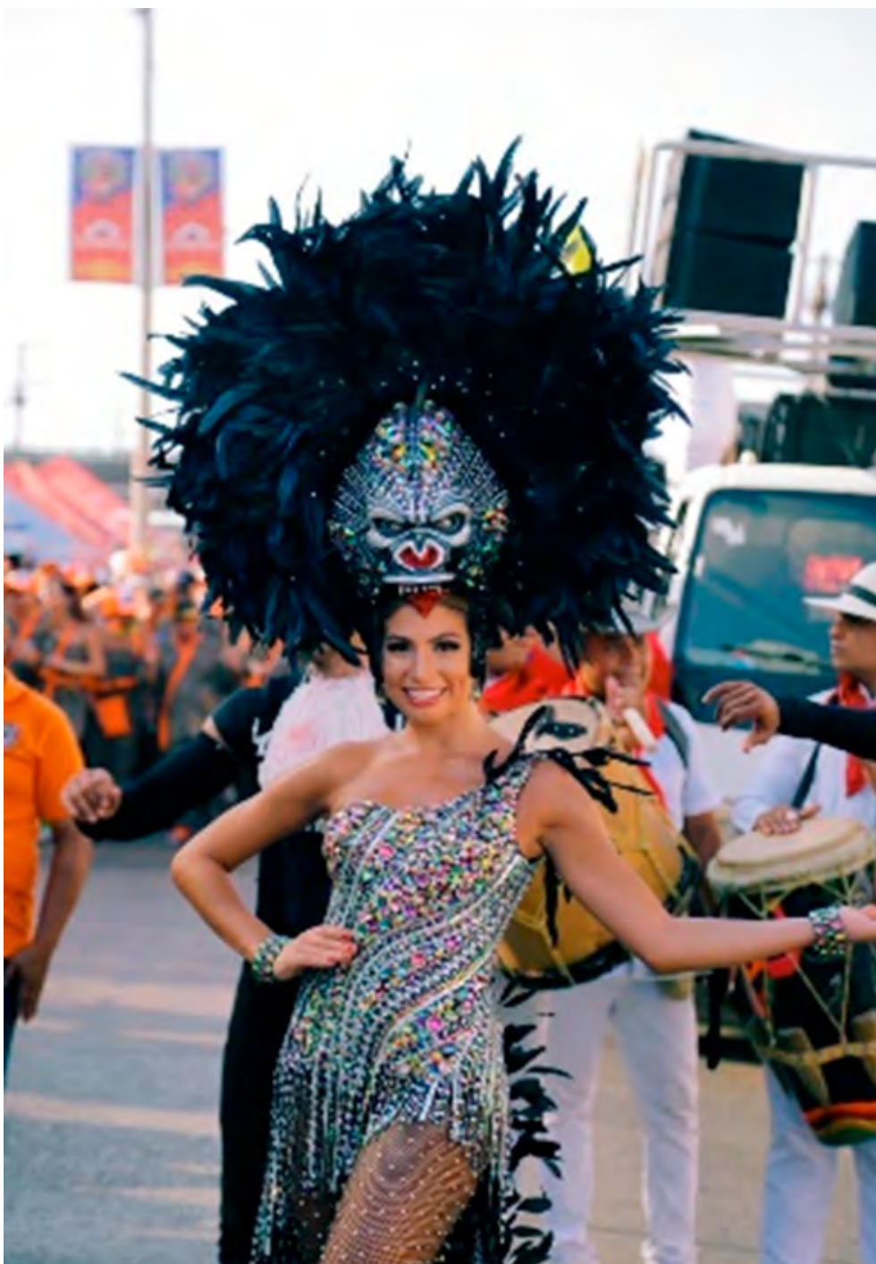
Figura 2. Traje de gorila vía 40. Barranquilla. (Canal Capital, 2020).