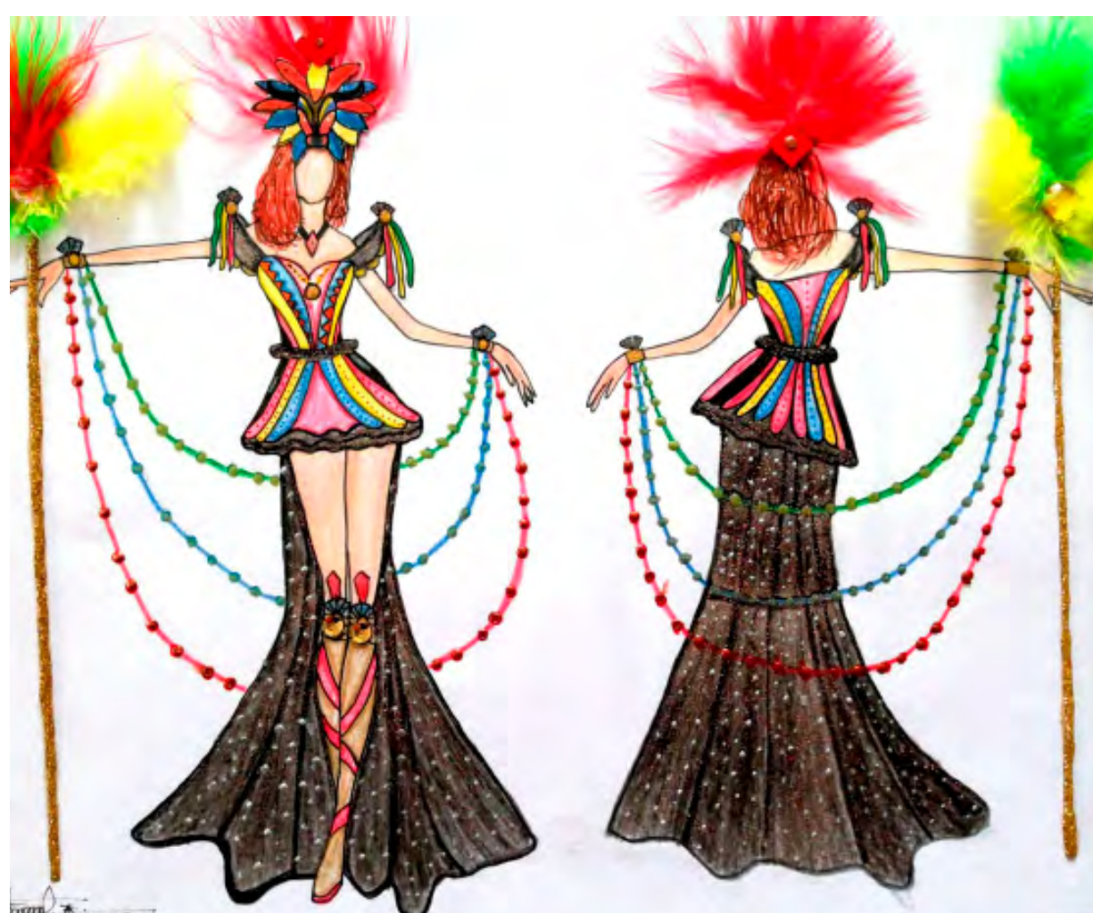
Ilustraciones: Mónica Julieth Borda y Julio César Martínez Imbachí