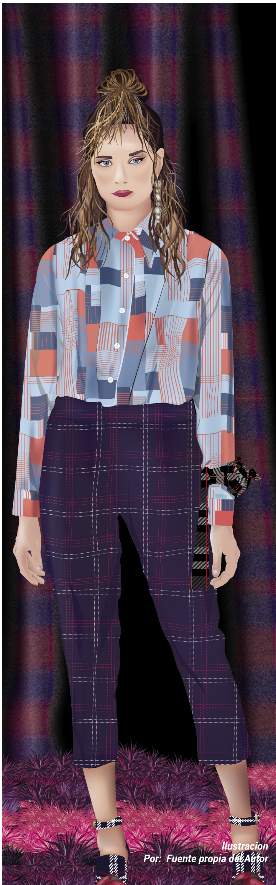
Ilustración Por: Fuente propia del Autor