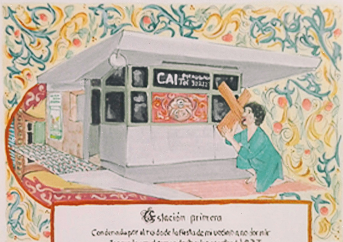
Estación primera Condenada por el ruido de la fiesta de mi vecino a no dormir Ignorada por el comisario y los agentes del CAI