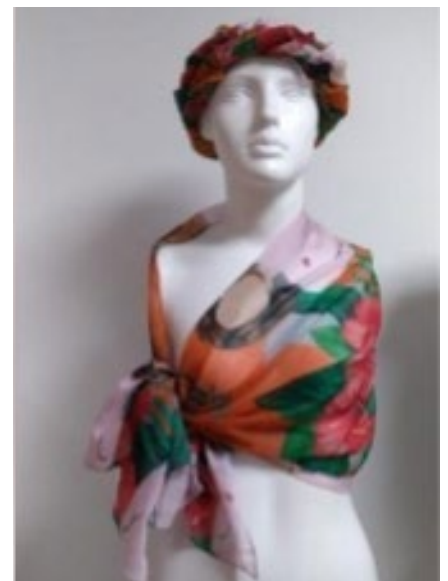
Imágenes archivo del programa. Diseño textil. Areandina - Diseño de modas - Diseño V - 2019-I

Con la aparición de bancos de imágenes, en especial los vectores descargables gratuitos, muchas empresas optan por utilizar este recurso en sus prendas lo que lleva en muchas ocasiones que sus estampados también los tenga su competencia, lo cual no aporta un valor diferencial para el cliente a la hora de la compra. Es por esto que el proceso del diseño de estampado contemplando habilidades de ilustración, composición y gráfica, permite generar elementos de identidad, originalidad y exclusividad, según el requerimiento del cliente, permitiendo que las empresas puedan competir con variables diferentes al precio.