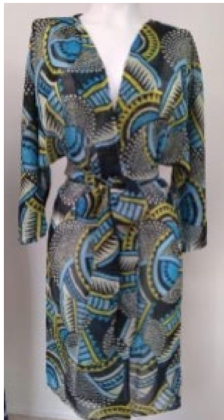
Imágenes archivo del programa. Diseño textil. Areandina - Diseño de modas - Diseño V - 2019-I

Desde la antigüedad el ser humano ha utilizado entre otros, el color y el diseño para distinguirse, aplicándolo sobre sus prendas en muchas ocasiones como símbolo de status y jerarquía dentro de la sociedad a la cual pertenecía. La estampación textil es la técnica que ha permitido agregar color textura y variedad a los textiles, combina diferentes áreas desde las más creativas como el arte hasta las más racionales como las ingenierías que logran que toda la imaginación del creativo pueda ser aplicada en un producto final. En la actualidad el estampado textil es de gran importancia para otros sectores como la tapicería, ropa de cama, ropa de baño, tapetes, papel tapiz entre otros, en respuesta a las necesidades y tendencias de consumo.